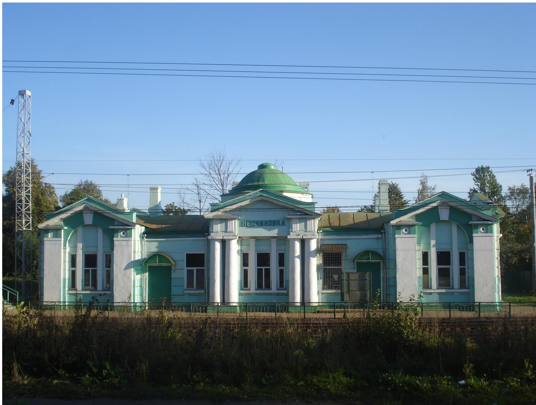
Железнодорожный вокзал в Немчиновке (2012 г.)