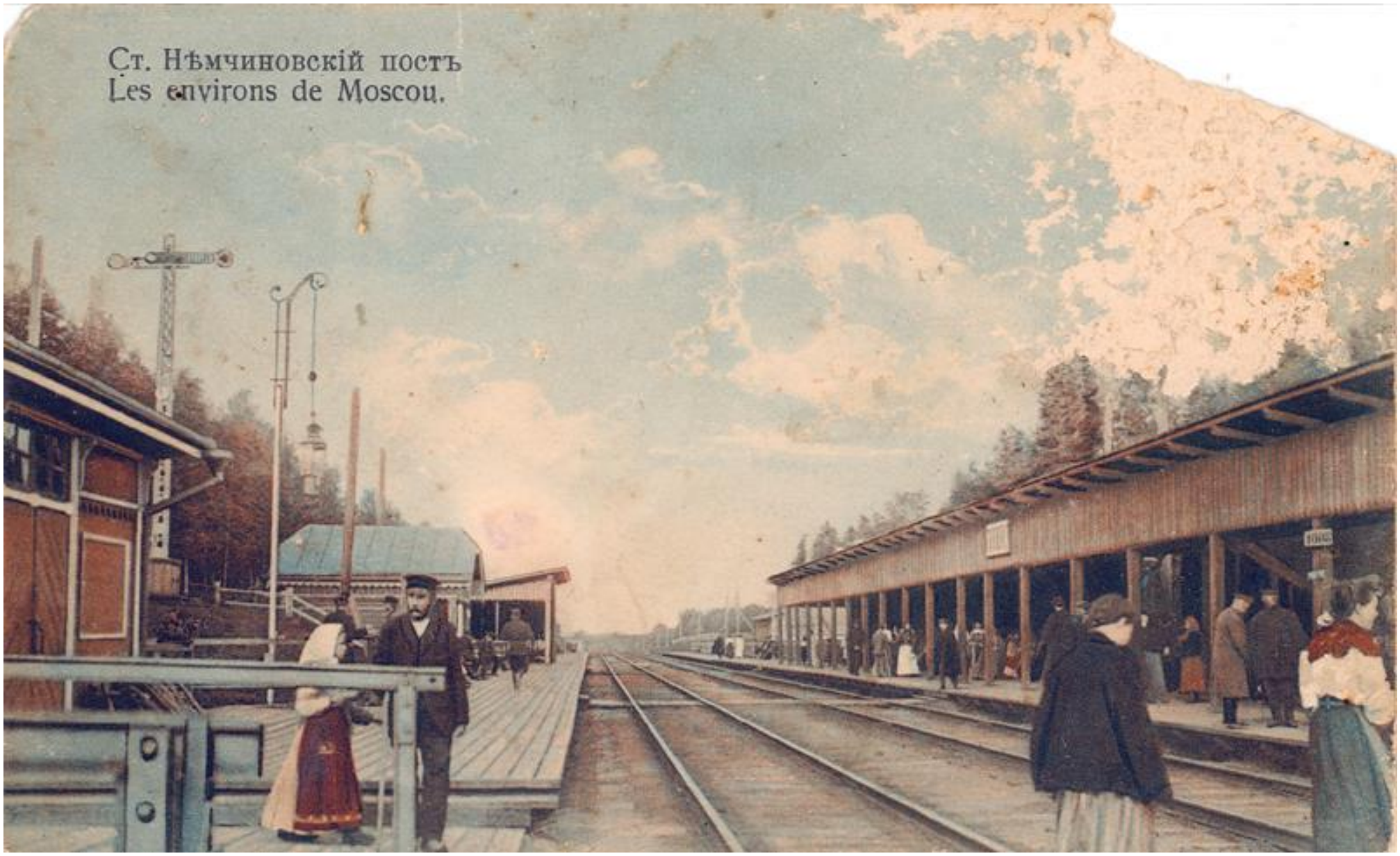
Станция Немчинов пост (начало 20 века)