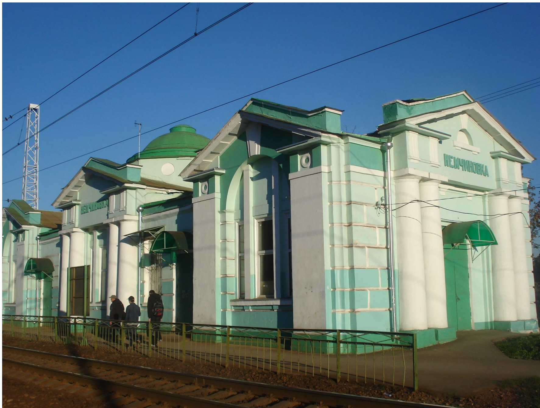
Железнодорожный вокзал в Немчиновке (2012 г.)