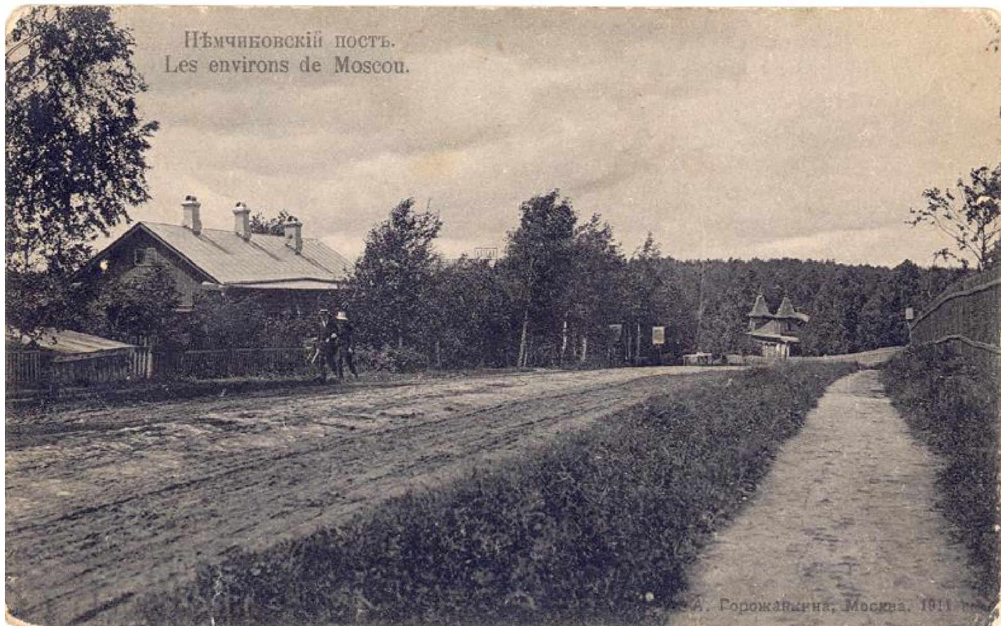
Станция Немчинов пост (начало 20 века)